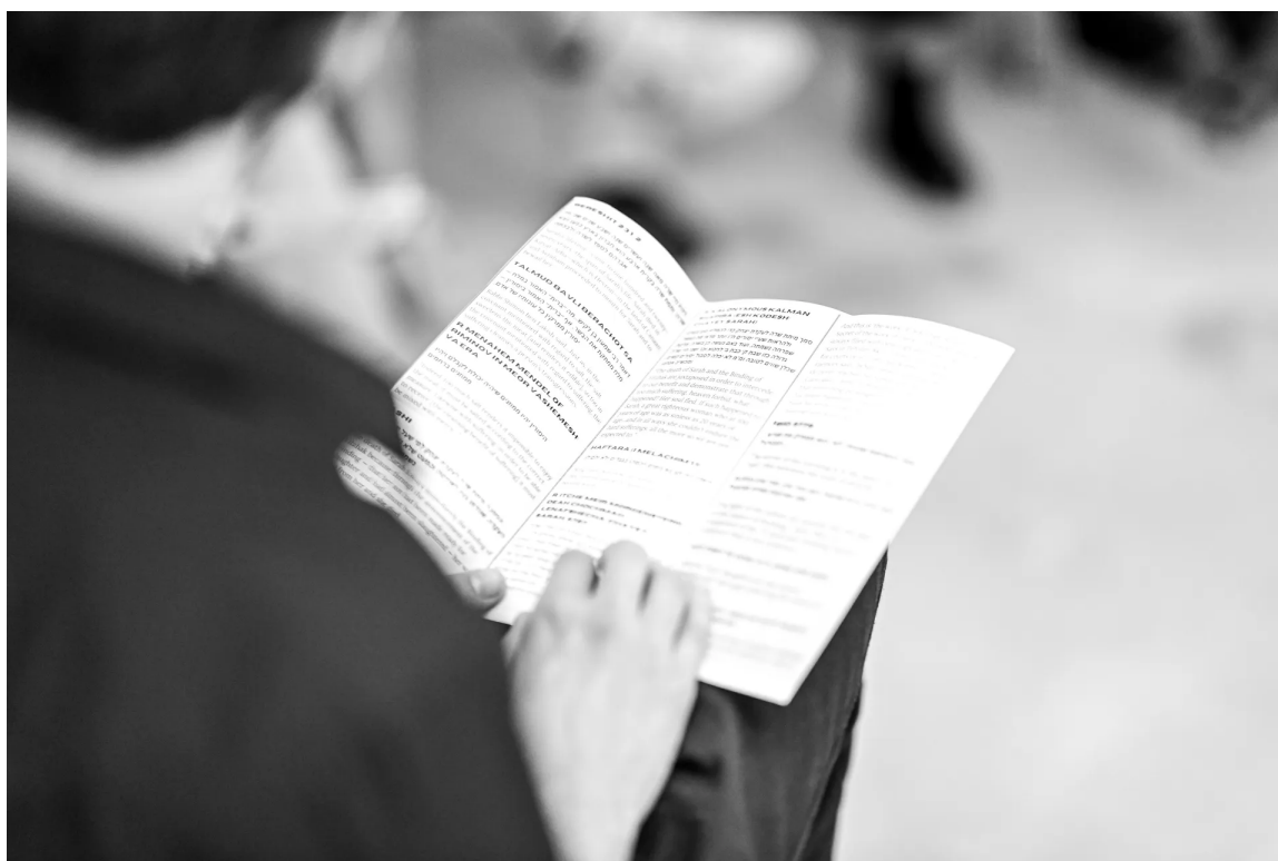
קריאה בטקסטים ב-Shiur. אסתטיקה של פאזין פאנק

יורק, בניסיון להגיע לאנשים רבים ככל הניתן. בתקופת הקורונה התחיל לתחזק קהילה גם בזום, וכשפרצה המלחמה ייסד את "Shiur במלחמה".