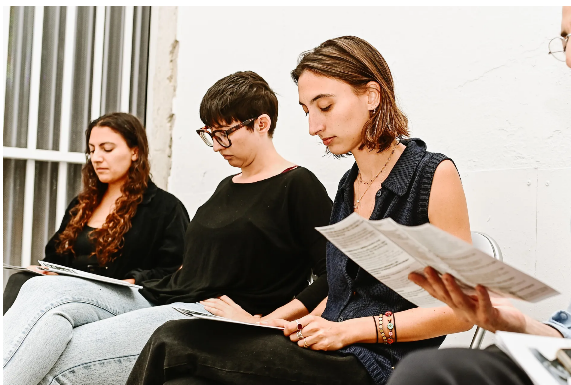
משתתפות ב-Shiur. המחסומים נופלים, למרות הרתיעה ממיסיונריות

להגדיר את עצמו כחילוני או כדתי ומוסיף: "אני ממליץ לכולם לעשות כמוני, ואני חושב שזה משהו שיהודים בישראל יכולים לאמץ מיהדות התפוצות".